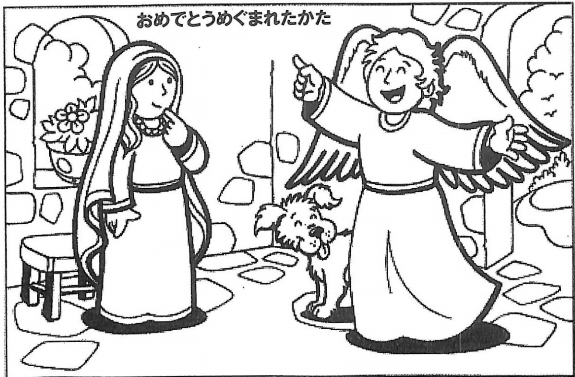
おめでとうめぐまれたかた