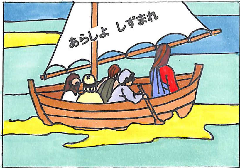
1. イエスさまはでしたちといっしょにむこうぎしへ わたるため、ふねにのっていました。