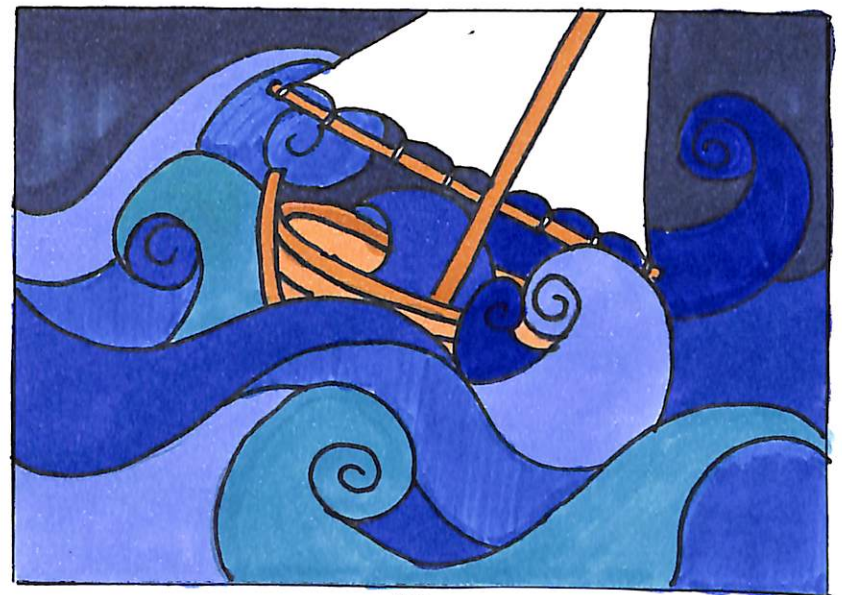
4. ふねのなかには○いっぱいになって ふねはしずみそうになりました。