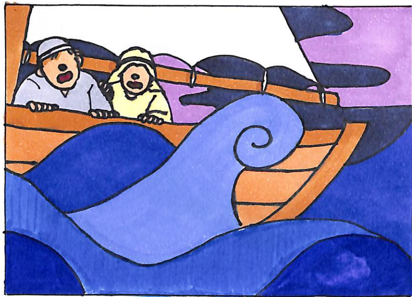
3. きゅうに みずうみは ○○○しまいました。